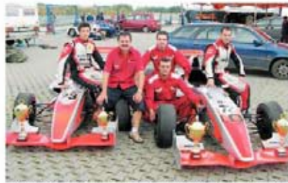
POZNANÝ VÝSLEK. VYJĚDE MOST? Po dvou doblech v úvodním podniku Karpatského poháru mají jezci i mechanici týmu Palmi motorsport důvod k radosti. Mými je čeká výjezd v podobě špičkově obsazeného závodu v Mostě.

Motivací má velkou, před domácími publikem rozhodně nechce zklamát. „Nebojím se říct, že tohle je druhá největší okruhová akce u nás, po MotoGP. Jedou se tedy jízdy, jedou se sporťáky, jedou se formule. Loni tady bylo přes padesát tisíc divá-